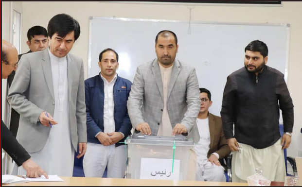
♦ م. ظ. صميم

د ټاکنو خپلواک کمپسيون وايي چې ددغه کمپسيون په داخلي ټاکنو کې اورنگزېب د دوو کلونو لپاره د نوموړي کمپسيون د رييس په توگه ټاکل شوی دی.