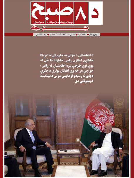
د افغانستان د سولې په چارو کې د امریکا ځانگړې استازې زلمې خلیلزاد ۱۵ ځل له یوې نوې طرحې سره افغانستان ته راغی؛ خو چې هر څه وي افغانان یوازې د جگړې د پای ته رسېدو او دايمي سولې د بنسټ غوښتونکي دي

نور نو افغانان له جگړې، وژنو او تاوتریخوالي سخت ستومانه شوي او د هر ډول طرحې او میکانیزم له لارې چې وي، دوی یوازې د امن او آرامه ژوند غوښتونکي دي.