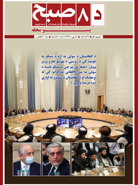
د افغانستان د سولې په اړه د مسکو په غونډه کې د روسیې د بهرنیو چارو وزیر وول: «هیله نن تم چې د مسکو ناسته د سولې په بڼه لاسلیک شي» پرمختګ او د افغانستان د ستونزو له اوارې سره مرسته وکړي.»