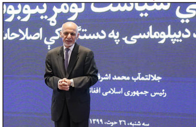
♦ م. ظ. صمیم

د هېواد ولسمشر محمد اشرف غني وايي چې که سبا د طالبانو ډله ټاکنو ته حاضره شي، هغه چمتو دی، خو له انتخاباتو پرته خپل ځای ناستي ته د واک سپارلو لپاره حاضر نه دی.