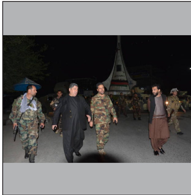
◆ د ۸ صبح پښتو مجله

په لغمان کې د ولایتي شورا غړي او قومي مشران اندېښمن دي، که حکومت بیا هم د وضعیت په کابو کولو کې بېغوري وکړي، نو لغمان به په بشپړه توګه د طالبانو لاسته ورشي.