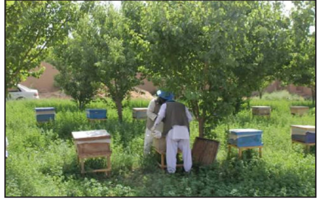
د ۸ صبح پښتو مجله