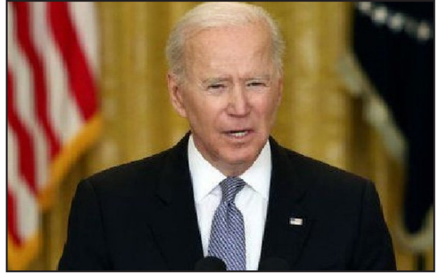
د ۸ صبح پښتو مجله

په غزه کې د اسرائیل او حماس ډلې ترمنځ د ۱۱ ورځینیو نښتو په ترڅ کې ځانې تلفاتو ترڅنګ مالي زیانونه هم ډېر دي. دغه خونړۍ نښتې وروسته له ۱۱ ورځو پروڼ جمع د دواړو لوریو لخوا د اوربند په ټینګښت سره پایته ورسېدې.