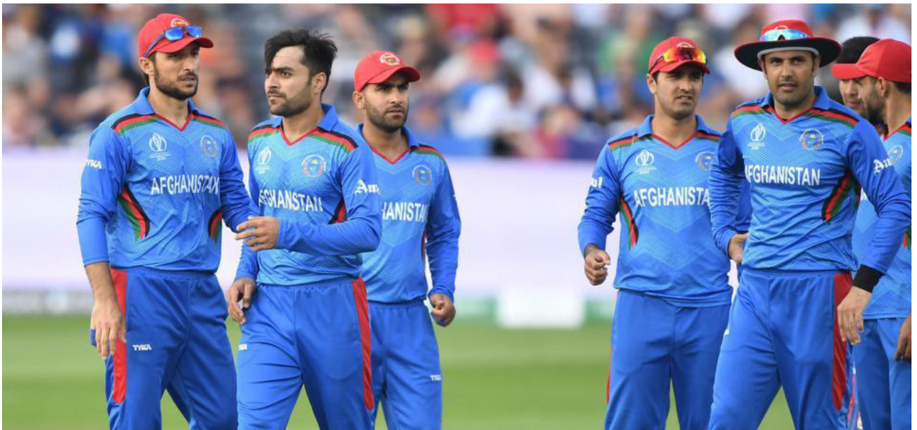
له استرالیا او ویسټ انډیز سره د روان کال په اکتوبر میاشت کې د کرېکټ شل اوریزي لوبې ترسره کېږي او تر راتلونکو دوو اونیو به د شل اوریزو سیالیو لوبډلمشر هم اعلان شي. اخوا، د افغانستان د کرېکټ سوداگریز لیگ APL سیالی. به هم د راتلونکي کال په فبرورۍ میاشت کې ترسره شي.