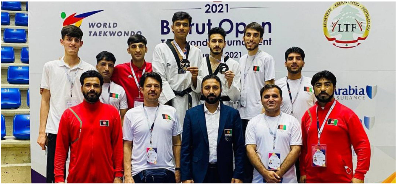
د افغانستان د تکواندو فېدراسيون اعلان کړی چې افغانستان د تکواندو په نړیوالو آسیایي سیالیو کې اووم مقام خپل کړ. د افغانستان د تکواندو فېدراسيون وايي چې تر دې وړاندې افغانستان په ۲۰۱۲ کال کې هم اووم مقام خپل کړی و.