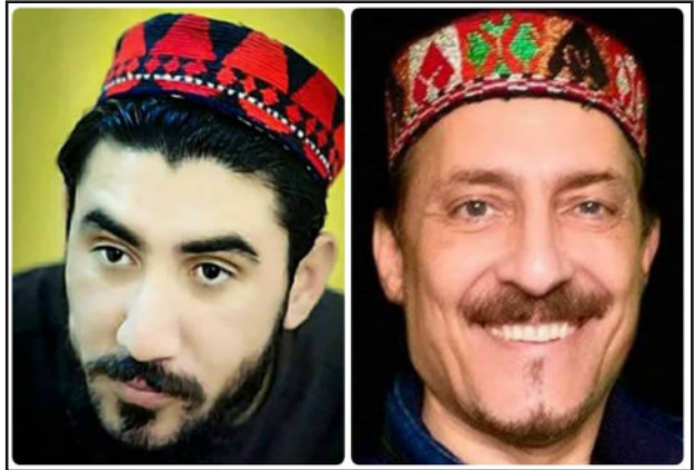
◆ لیکنه: فرهاد دریا ◆ ژباړه: ډاکټر ساپی