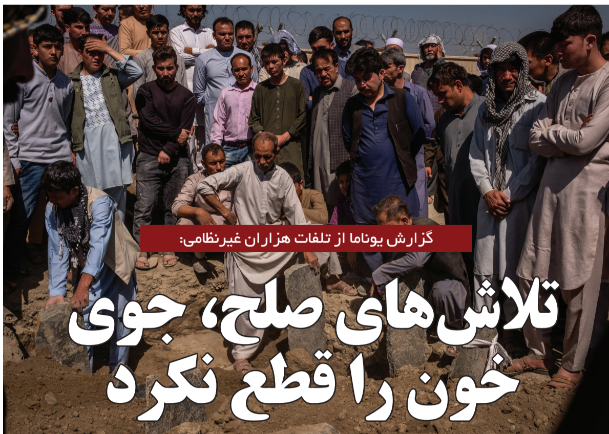
گزارش یوناما از تلفات هزاران غیر نظامی؛