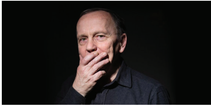
«کریستین بوبن» (Christian Bobin) نویسنده و شاعر فرانسوی که بیش از ۳۸ اثرش تا کنون به زبان فارسی ترجمه شده است، درگذشت.

سایت رسمی انتشارات گالیمار (Éditions Gallimard) ناشر اختصاصی آثار او به زبان فرانسوی، از درگذشت این نویسنده معروف فرانسوی، روز جمعه، ۲۵ نوامبر ۲۰۲۲، در سن ۷۱ سالگی خبر داد، اما به جزئیات دلیل مرگ این چهره سرشناس ادبی اشاره نکرد.